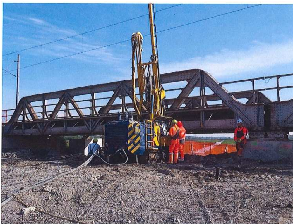
Trysková injektáž na moste v km 73,466 – SO 12-33-02