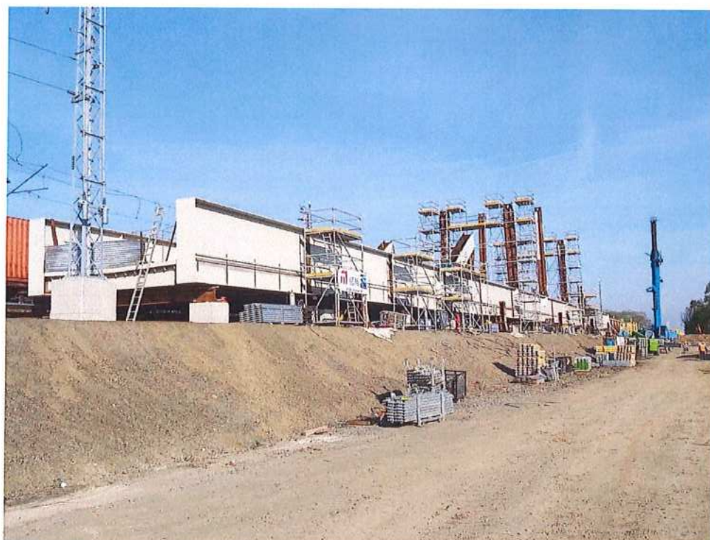
Montáž oceľovej konštrukcie mosta - SO 12-33-04