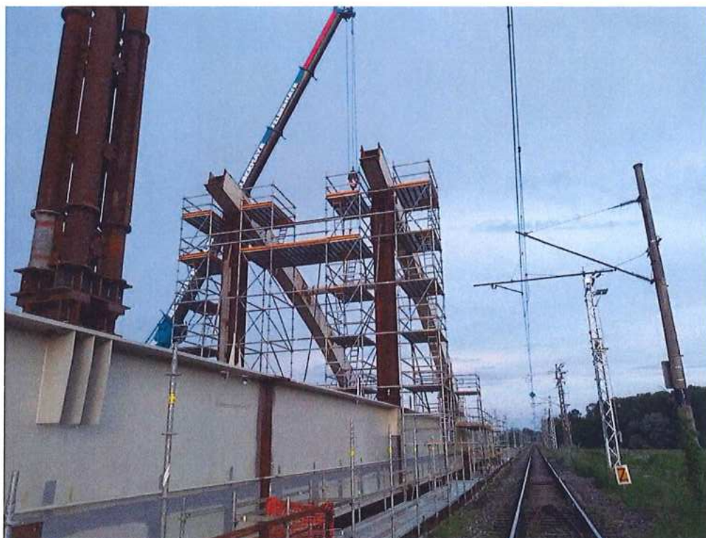
Montáž ocelejovej konštrukcie mosta - SO 12-33-04