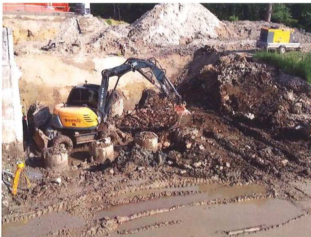
Odkop okolo pilót pri opore OP2 na strane CZ - SO 12-33-04