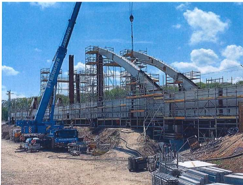
Montáž ocelejovej konštrukcie mosta - SO 12-33-04