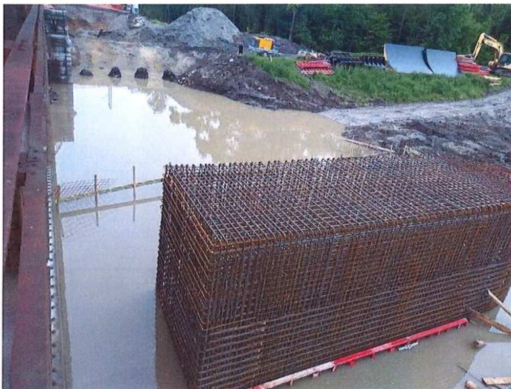
2. Stupeň povodňovej aktivity na rieke Morava - SO 12-33-04 (pilier P2 CZ strana)