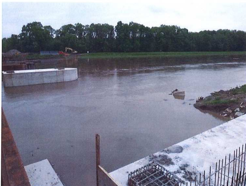
2. Stupeň povodňovej aktivity na rieke Morava - SO 12-33-04 (pohľad na CZ stranu)