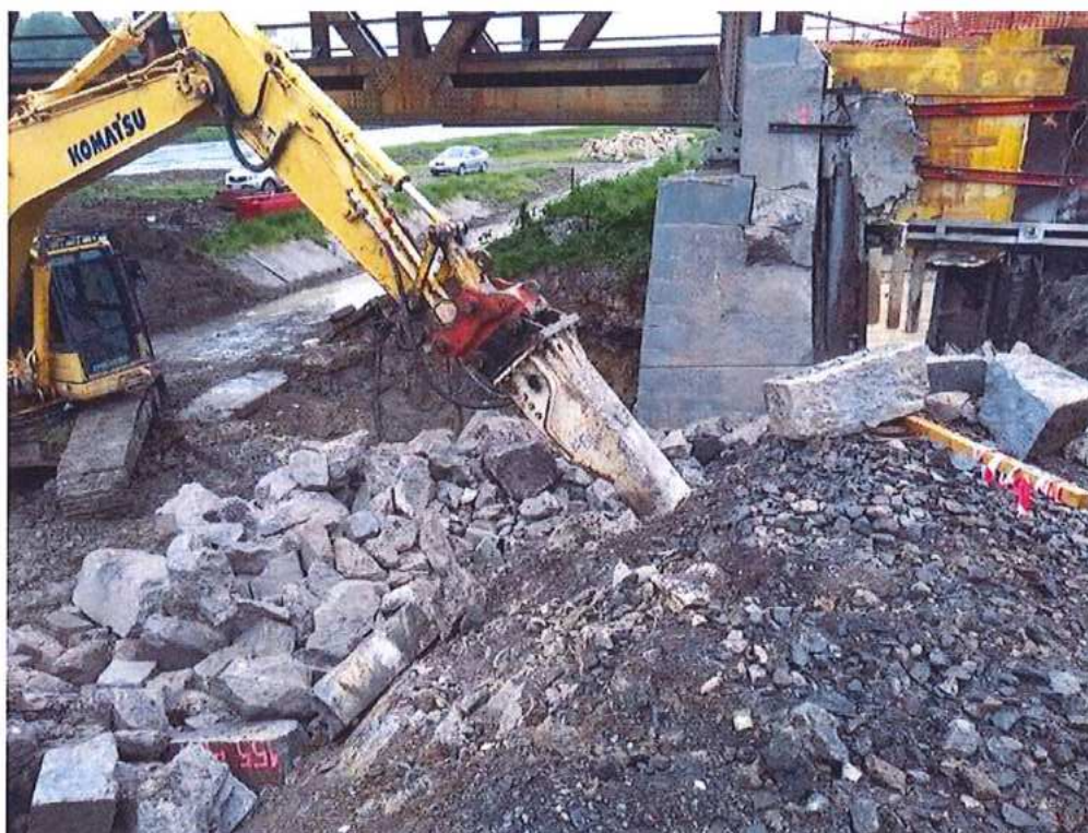
Búranie opory OP2 na strane CZ - SO 12-33-04