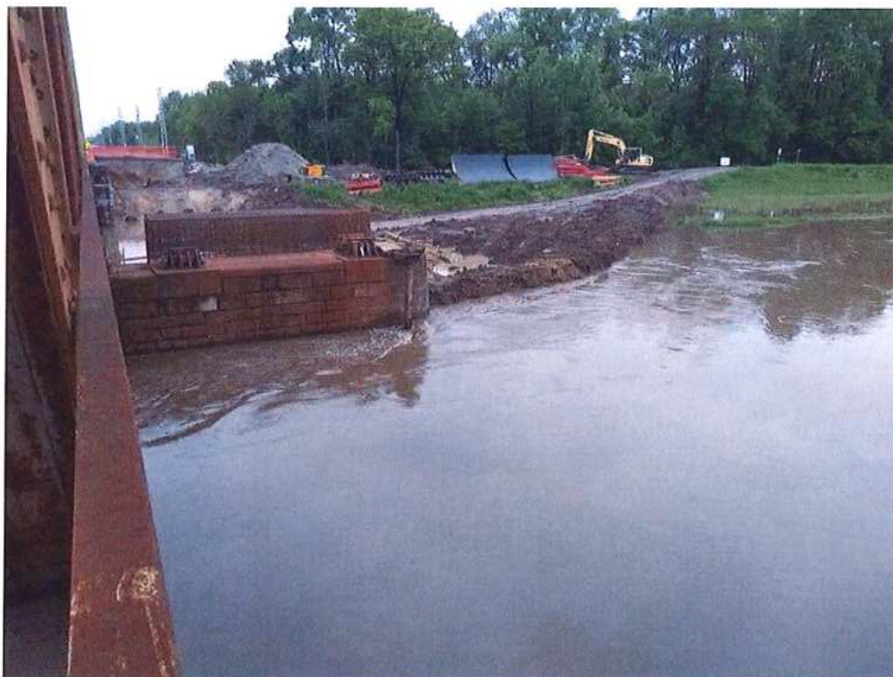
2. Stupeň povodňovej aktivity na rieke Morava - SO 12-33-04 (pohľad na CZ stranu)