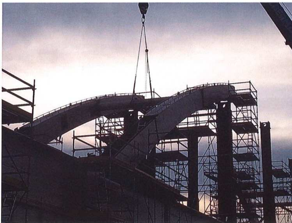
Montáž oceľovej konštrukcie mosta - SO 12-33-04