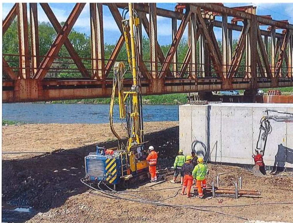
Trysková injektáž pilóty P1 SK strana - SO 12-33-04