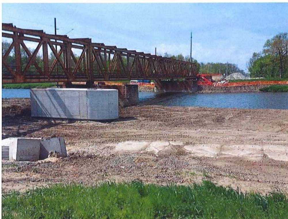
Terénne úpravy pri pilieri P1 SK strana – SO 12-33-04