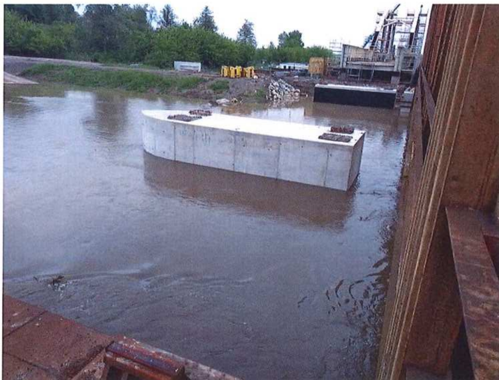
2. Stupeň povodňovej aktivity na rieke Morava - SO 12-33-04 (v pozadí OPI SK strana)