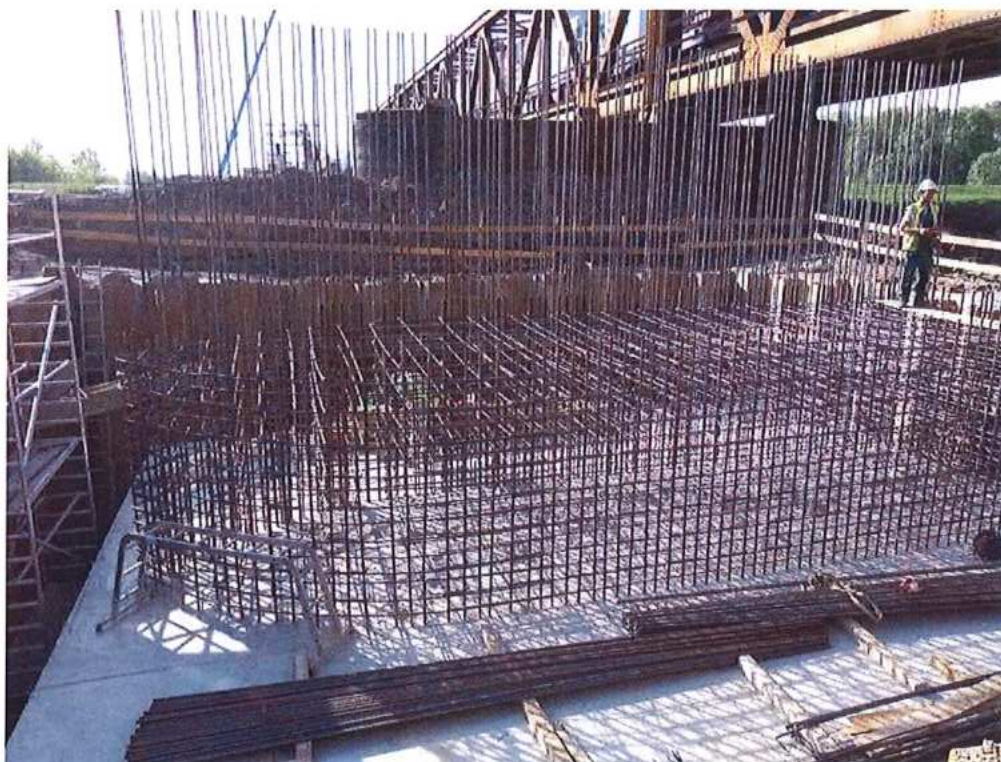
Armovanie piliera P2 CZ strana - SO 12-33-04