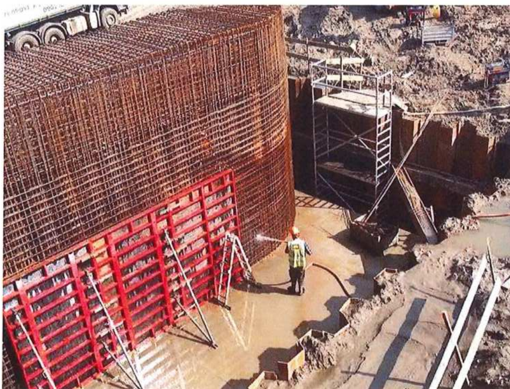
Čistenie výstuže pilier P2 po povodni - SO 12-33-04