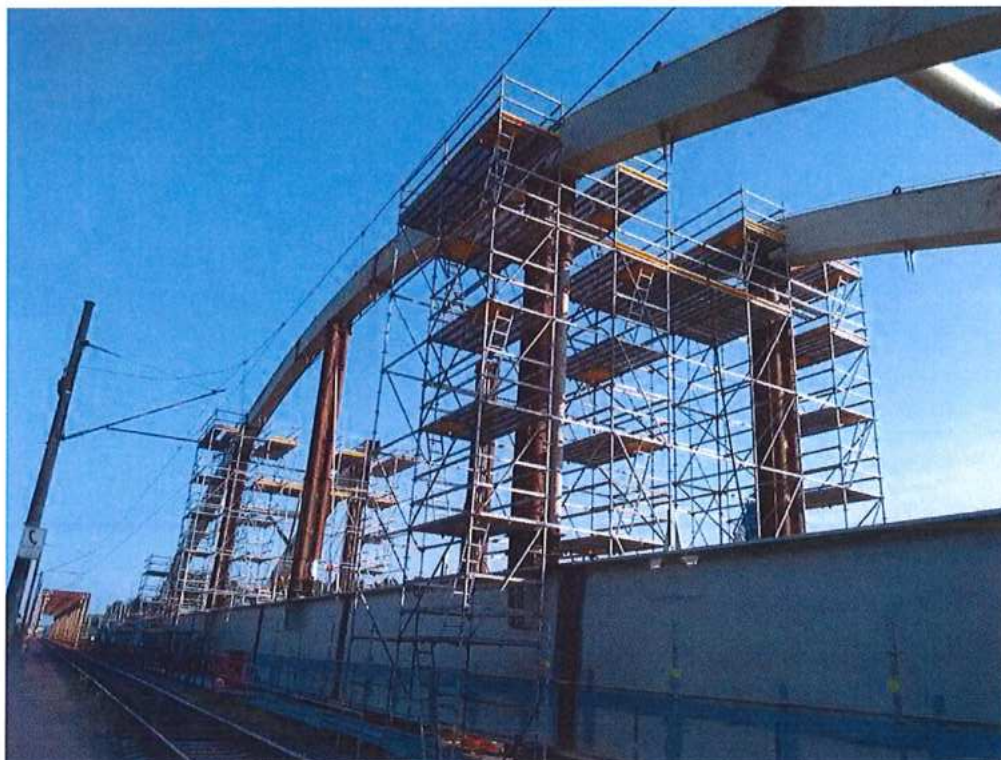
Montáž oceľovej konštrukcie mosta - SO 12-33-04