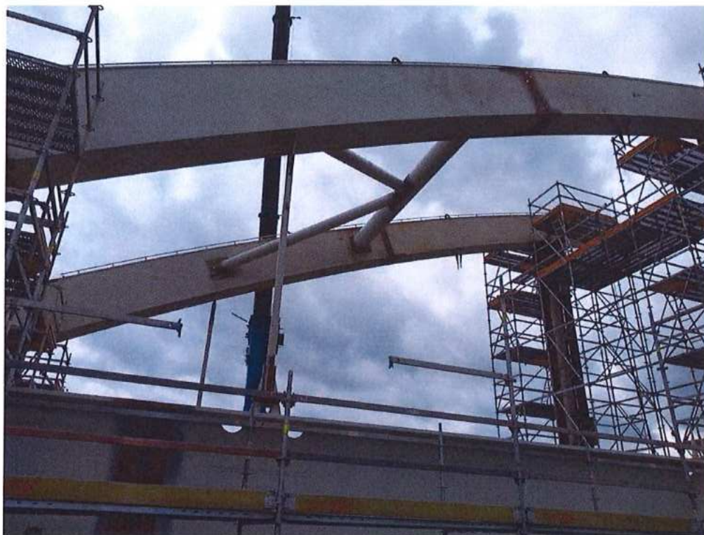
Montáž ocelejovej konštrukcie mosta - SO 12-33-04