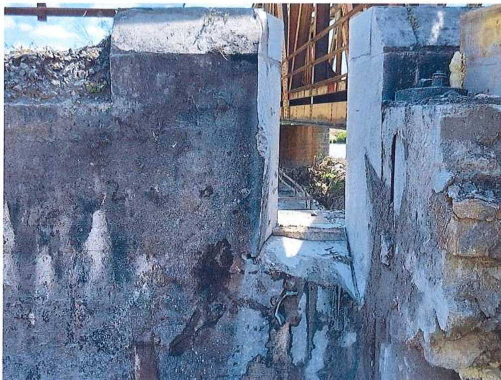
Rezanie opory OP2 na strane CZ pred búraním - SO 12-33-04