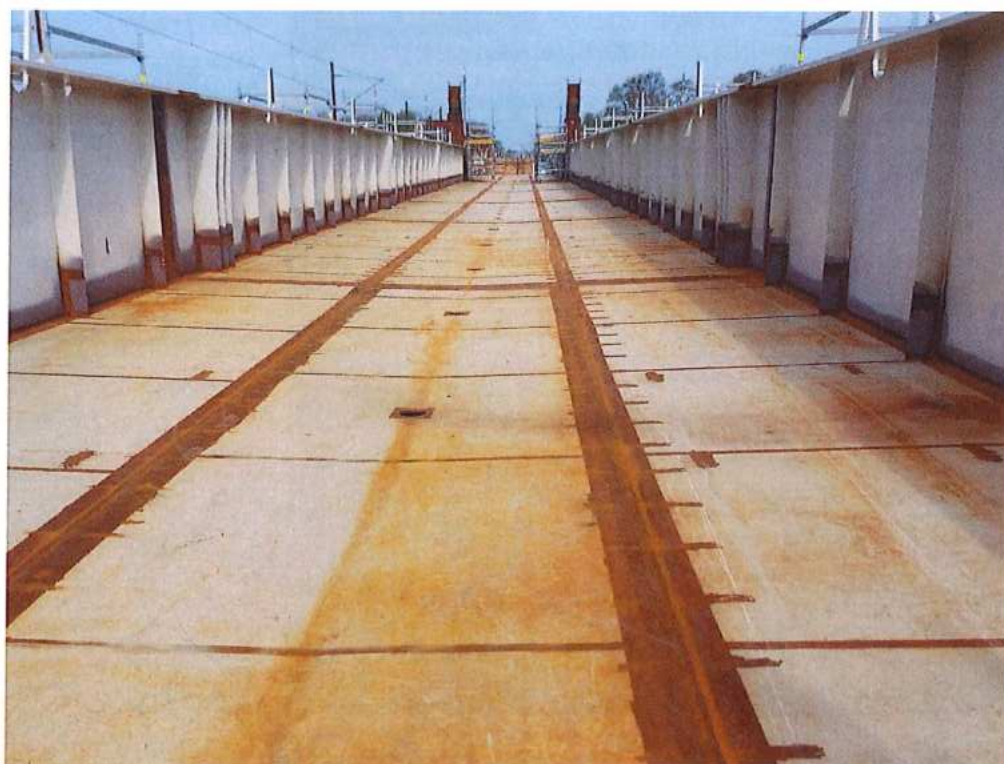
Pohľad na oc. mostovku – príprava na vizuálnu kontrolu zvarov – SO 12-33-04