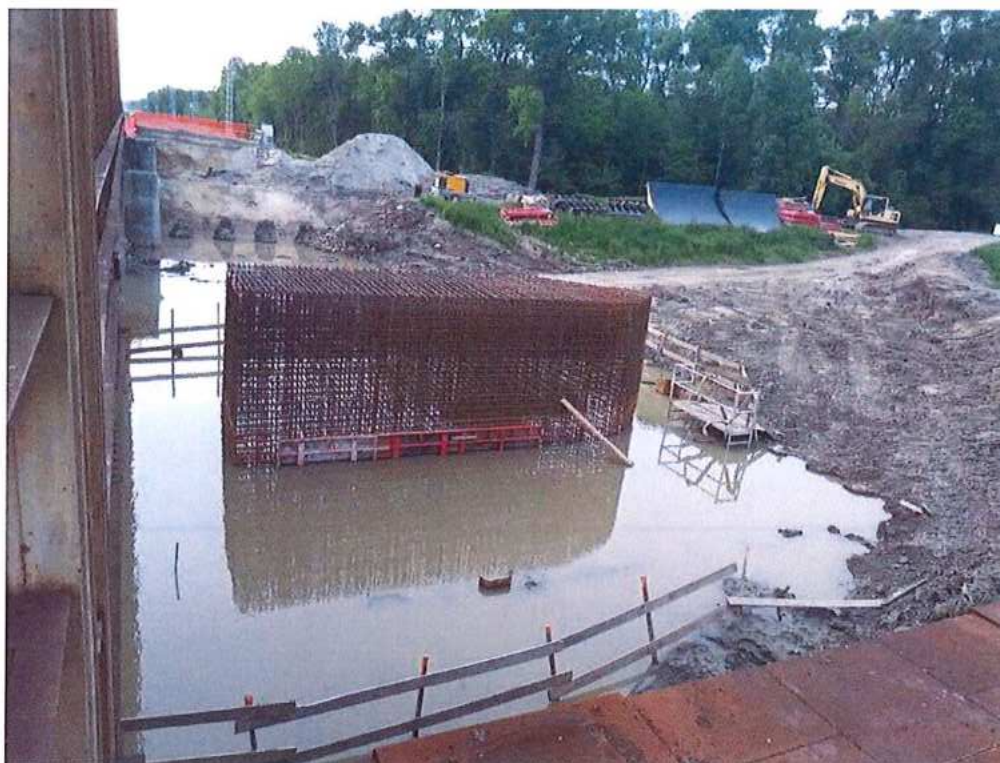
Zaplavený pilier P2 po povodni - SO 12-33-04