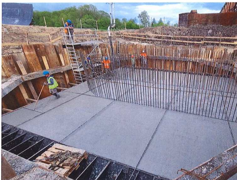
Betonáž základu piliera P2 CZ strana – SO 12-33-04