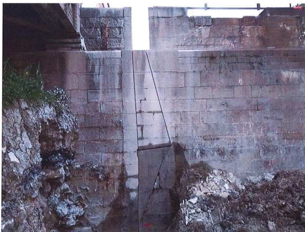
Rezanie opory OP2 na strane CZ pred búraním - SO 12-33-04